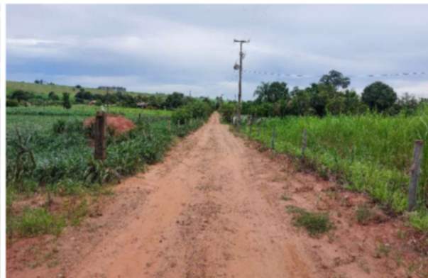
Trecho 02 Cont. Farinh. (Matadouro) – (de 220 até 420 m)