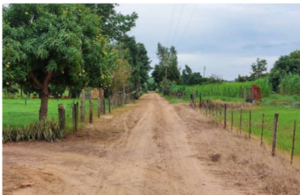
Trecho 03 Cont. Farinh. (Matadouro) – (de 420 até o Final)