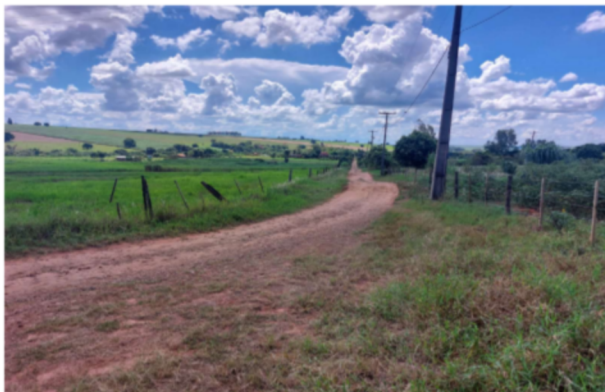
Trecho 01 Cont. Farinh. (Matadouro) – (Início até 220 m)